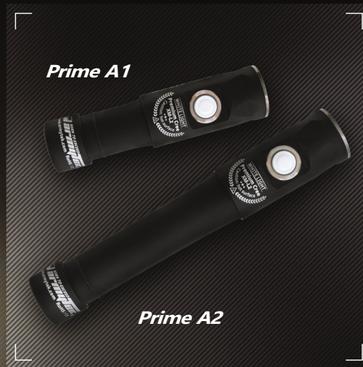
На распространенном питании AA