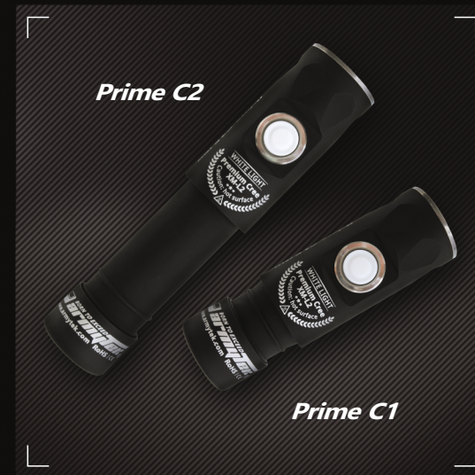
На мощных литиевых батареях